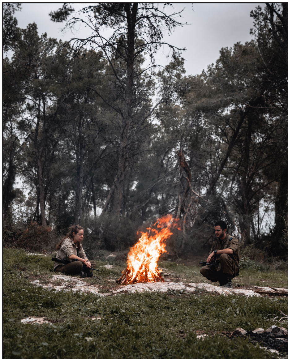
מסביב למדורה