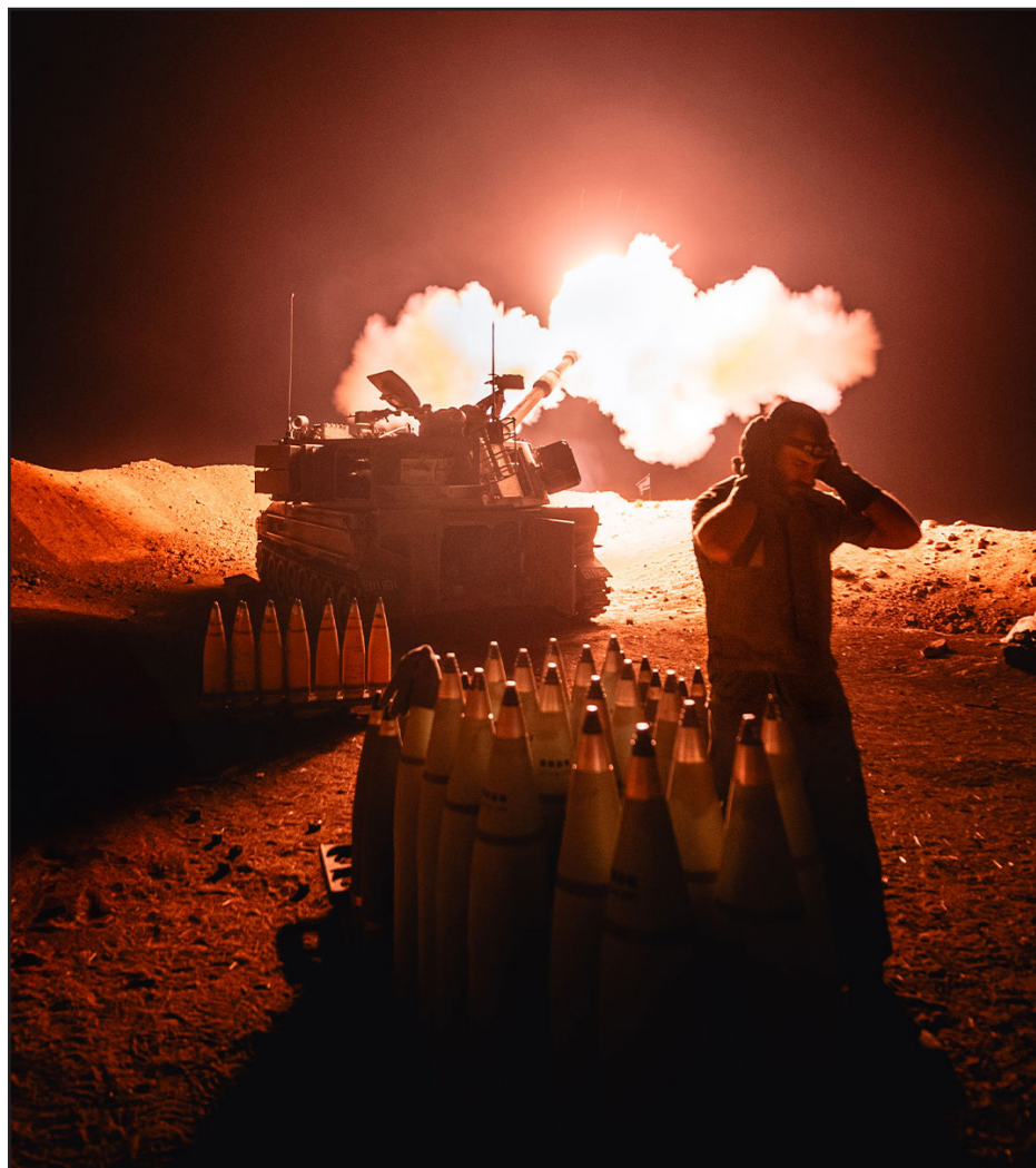
העוצמה שבפיצוץ