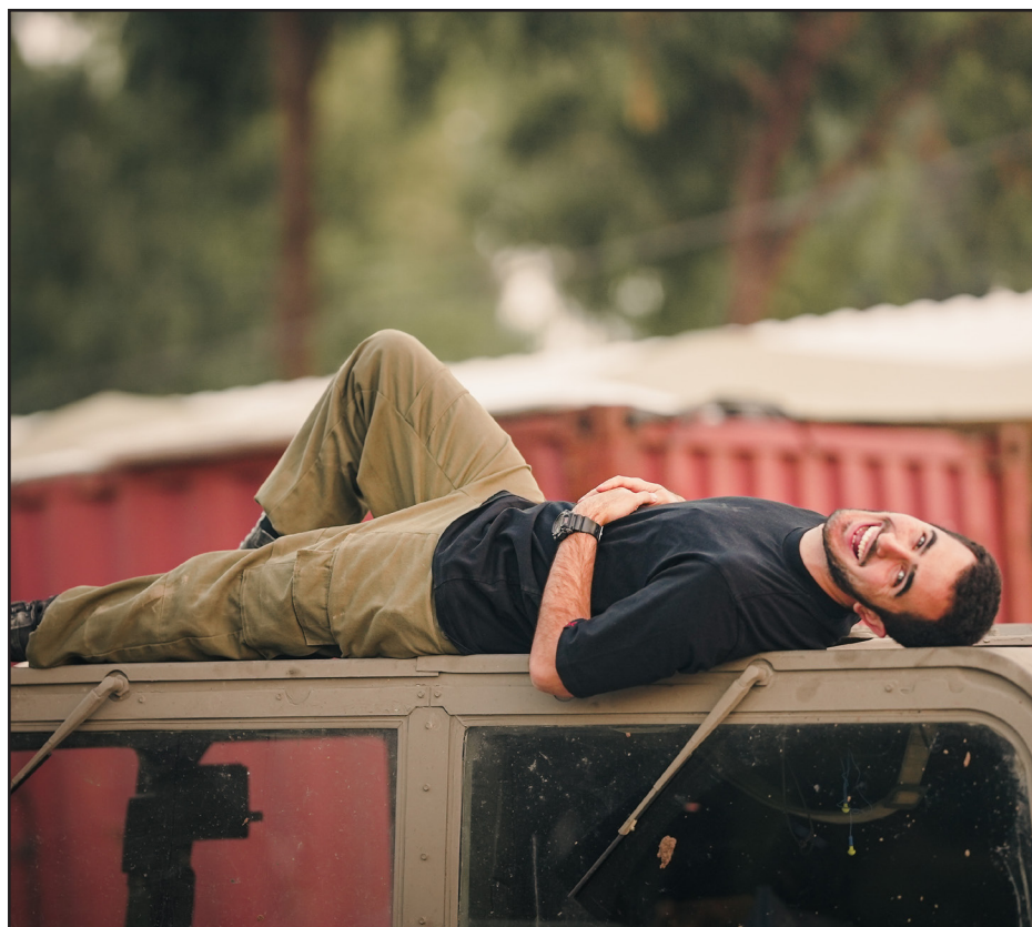
סתלבט על ההאמר