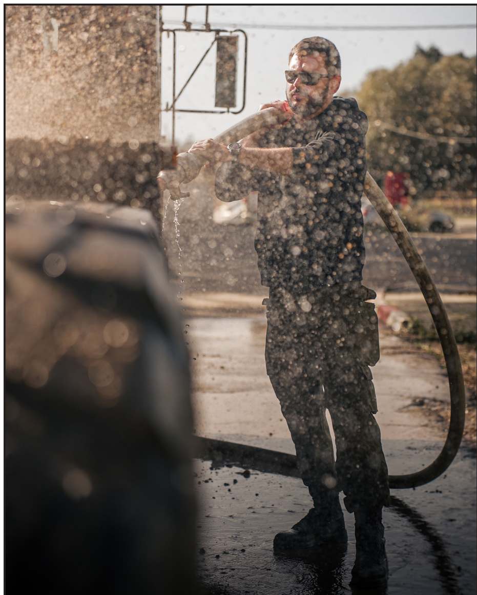
ניקיונות שישי