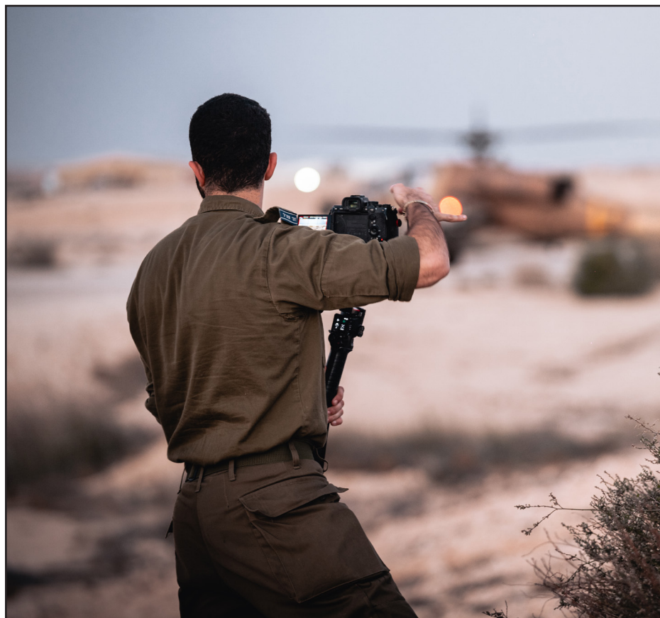
לתפוס את הרגע