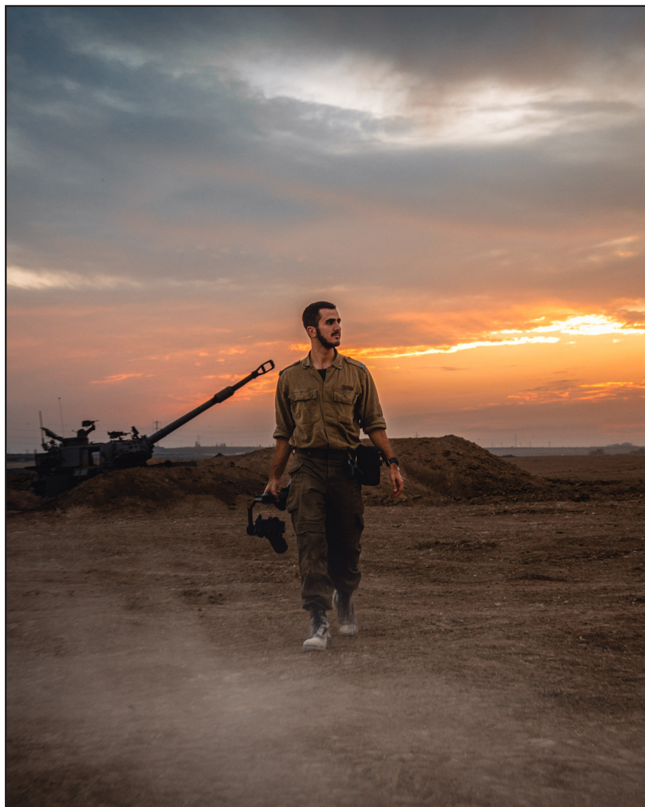
שקיעה, חייל ותותח