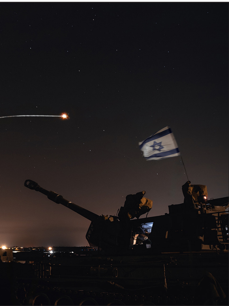
שמים מלאי כוכבים