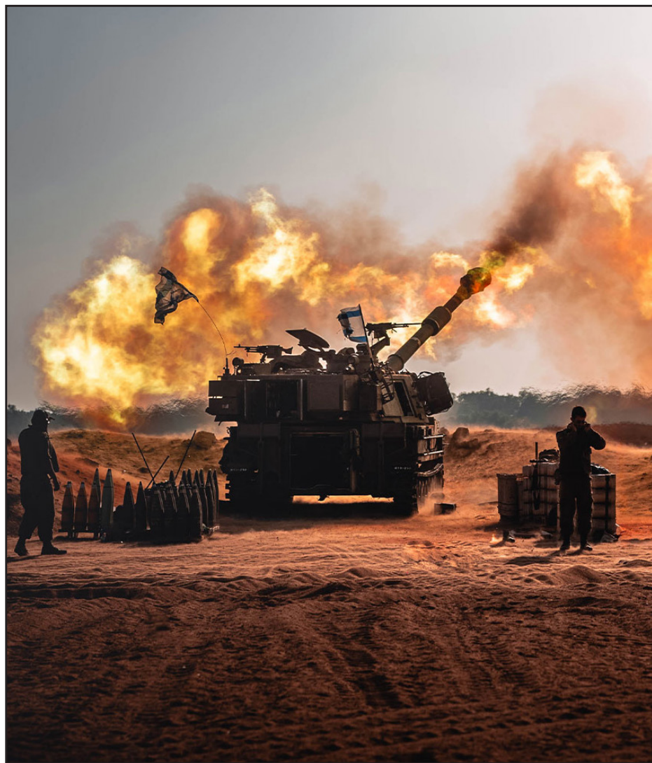
כשהתותחים רועמים המוזות שותקות