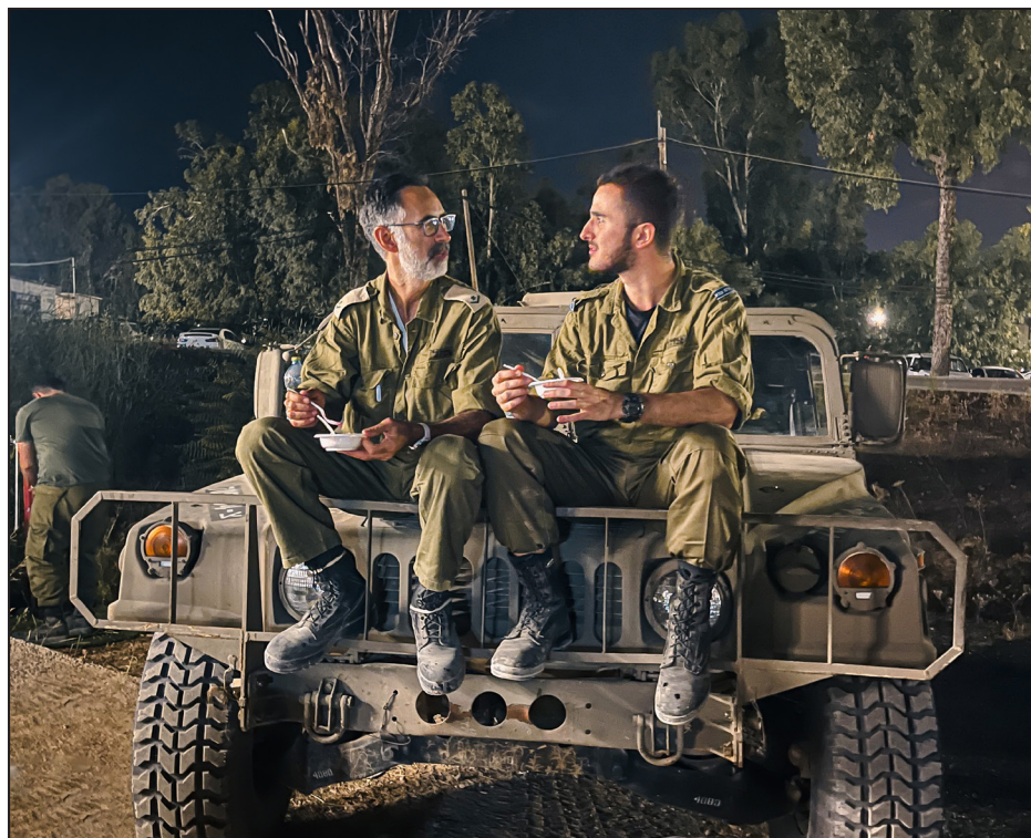
מילואים וסדיר | אב ובנו