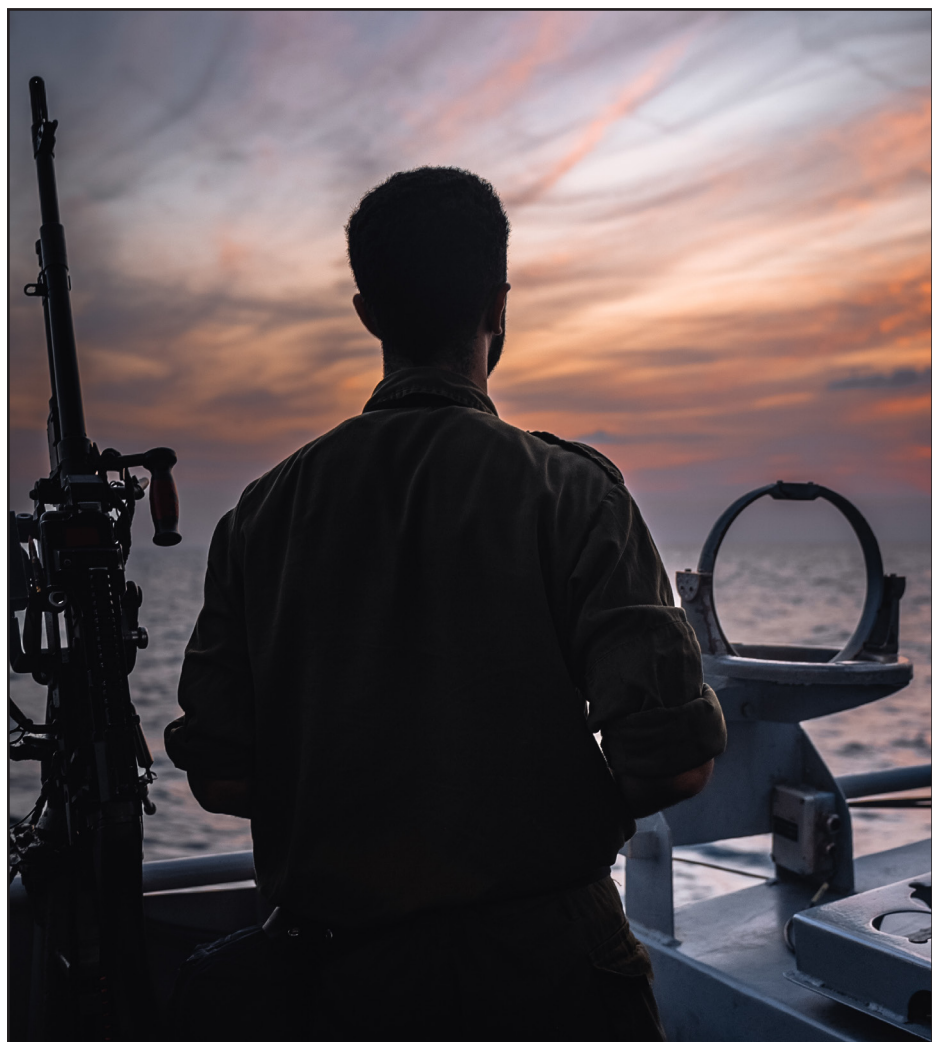
ים גם בחורף