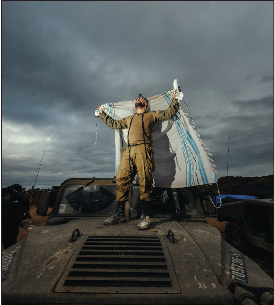
השמש שוב תזרח