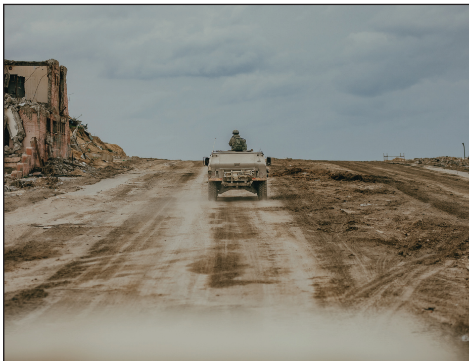
הדרכים נמלאו בוץ