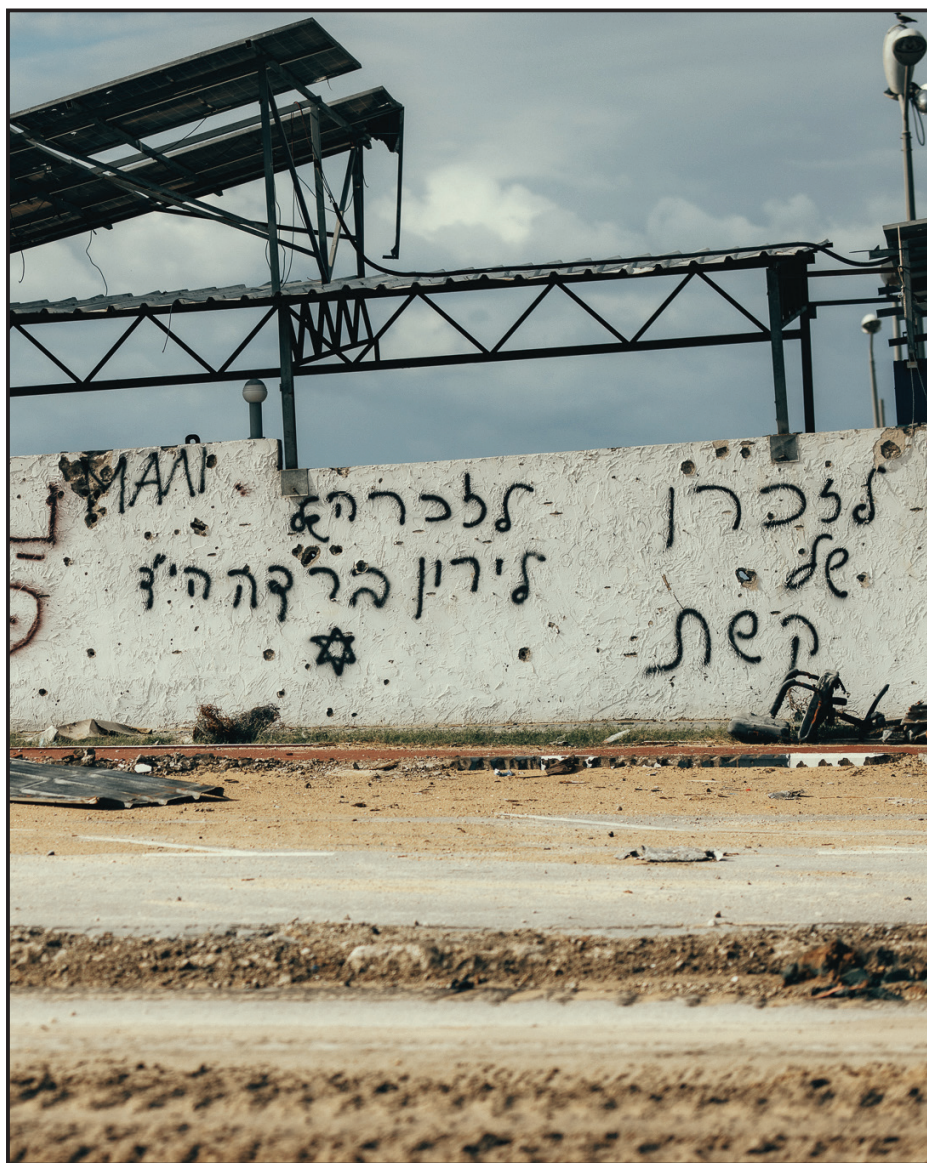
יהא זה לפרסום כי דמנו לא הותר