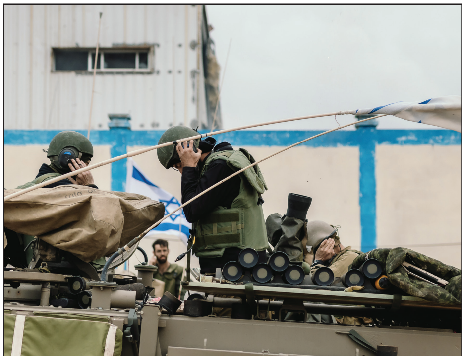
אני שומע את אלוהים בוכה