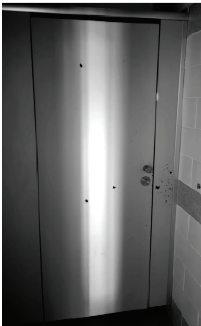
דלת, בסך הכל דלת