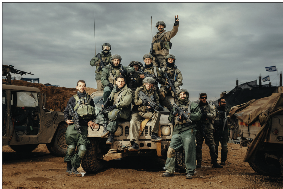
עלו חלוצים אל ארצך