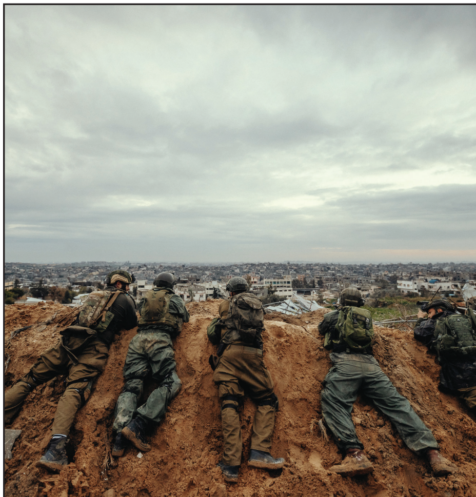
כאב העדינות שנרמסה אל האדמה