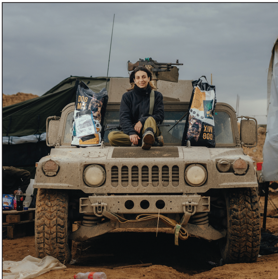
עוד חיים פורחים ויפים מצפים לה