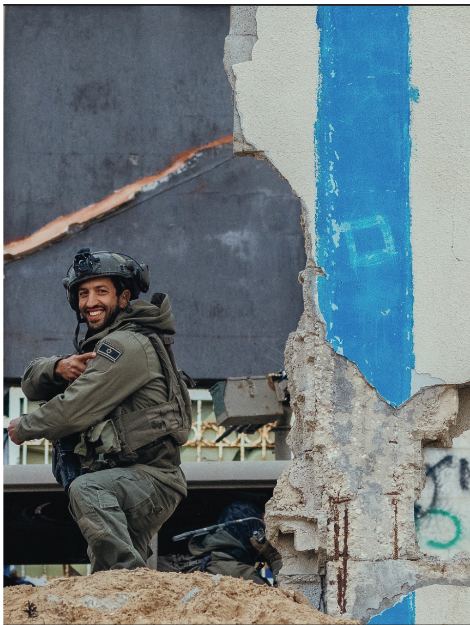
העוצמה שבחיוך