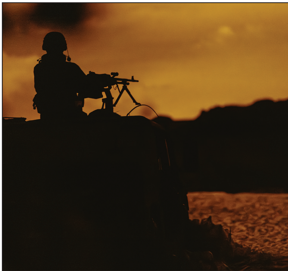
עוד לילה נטול שינה