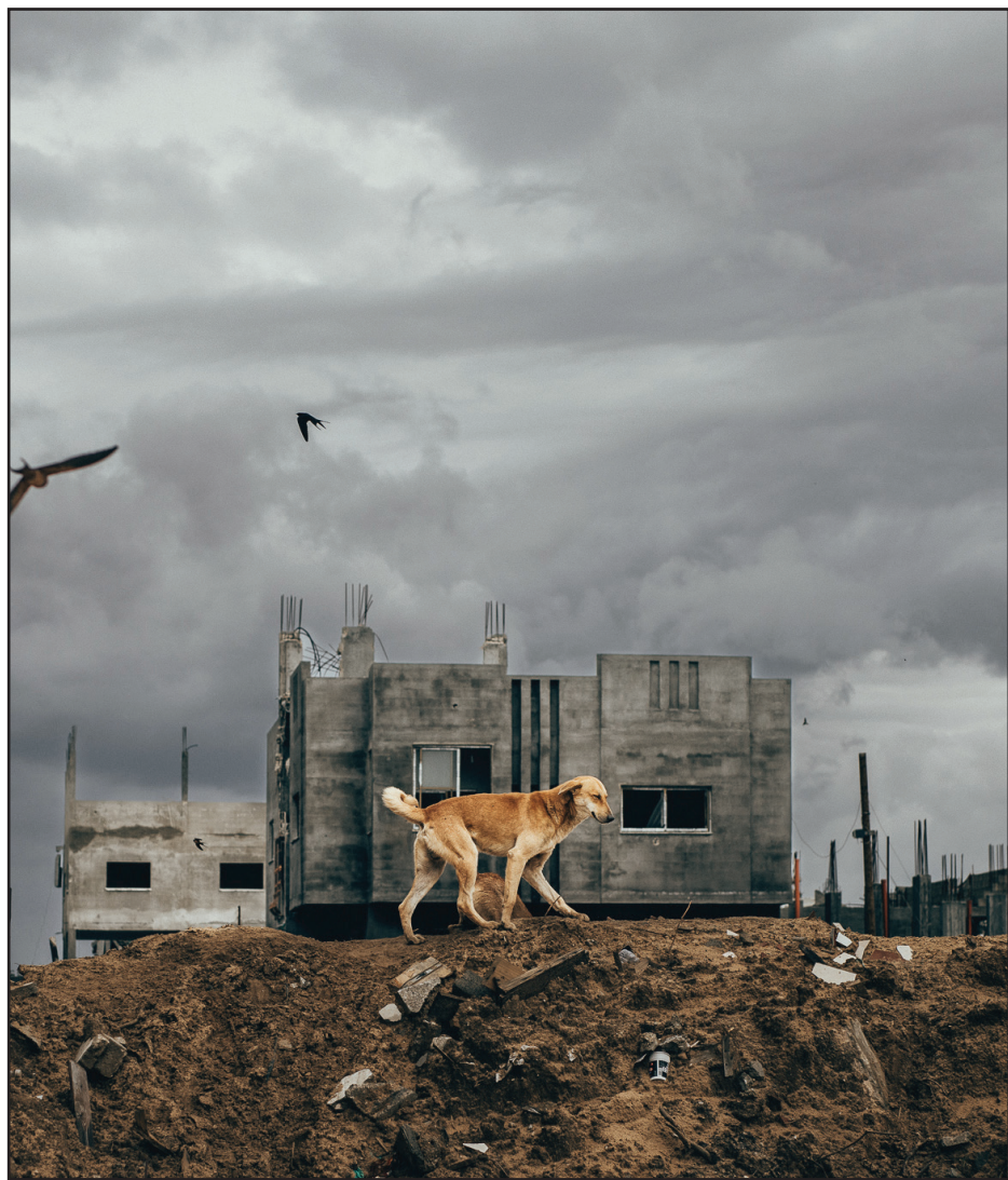
שיטוט תושיה ברחבי עזה